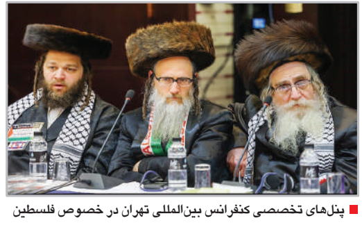
پهل‌های تخصصی کنفرانس بین‌المللی تهران در خصوص فلسطین