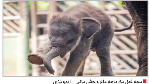
بچه فیل یکماهه باغ وحش بالی - اندونزی