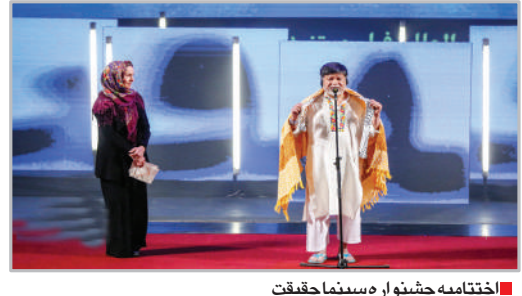
اختتامیه جشنواره سینما حقیقت