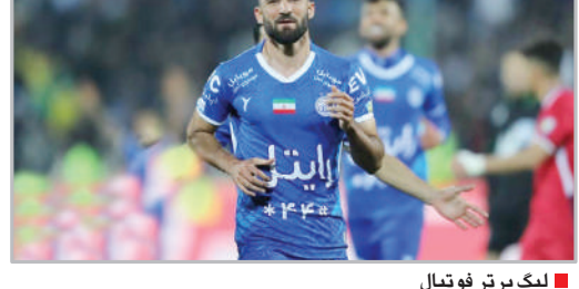
لیگ برتر فوتبال