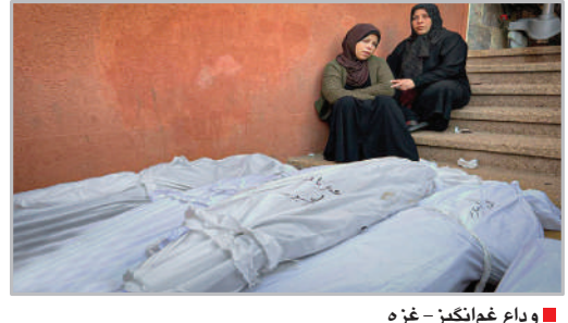
وداع غم‌انگیز - غزه