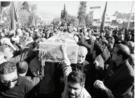
مراسم تشییع و خاکسپاری پیکر یک شهید گمنام دیگر نیز در ساعت ۱۴:۳۰ در مرکز آموزشی شهید دستغیب (ره) فراجا شهرستان جهرم برگزار شده و پیکر مطهر یک شهید گمنام دیگر در ساعت ۱۰ صبح روز جمعه، ۸ دی‌ماه در تپه مشرف به شهر اکبرآباد شهرستان جهرم، کوار و پیکر مطهر آخرین شهید گمنام این‌ کاروان نیز ساعت ۱۴:۳۰ همان روز در شهر عماد شهر شهرستان خنج به خاک سپرده خواهد شد.