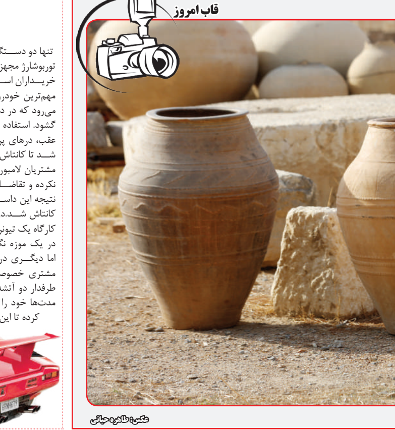
ظروف سفالی تخت جمشید

مهم‌ترین خودروهای تاریخ سنت‌آگاتا به شمار می‌رود که در دهه هشتاد میلادی دیده به جهان گشود. استفاده از بال بزرگ (و البته بلااستفاده) در عقب، درهای پروانه‌ای و طراحی قابل توجه باعث شد تا کانتاش بر سر زبان‌ها بیفتد. ظاهراً برخی مشتریان لامبورگینی به خاص بودن کانتاش بسنده نکرده و تقاضای چیزی فراتر از آن را داشته‌اند. نتیجه این داستان تولید دو نسخه بسیار خاص از کانتاش شد. دو نمونه اولیه مجهز به توربوشارژر از کارگاه یک تیرور توانا خارج شدند که یکی از آن‌ها در یک موزه نگهداری می‌شود، اما دیگری در دست یکی مشتری خصوصی است. یک طرفدار از آتش لامبورگینی مدت‌ها خود را مشغول آن کرده تا این